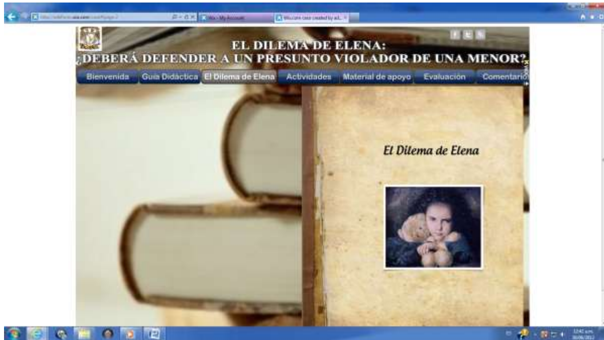
Figura 2. “El Dilema de Elena”

El Dilema hace referencia a la decisión profesional que deberá tomar Elena, joven abogada a quien le han confiado la defensa de un presunto violador de una menor de edad, situación que le genera un conflicto ético, se describen los actores o personajes centrales del caso, así como las interrogantes que los estudiantes deberán responder a partir de la reflexión y análisis del dilema que se describe para arribar a la toma de decisiones y posibles soluciones en el marco de la ética profesional. El “Dilema de Elena” aborda tópicos complejos de acuerdo a los postulados de Wasserman (2006)