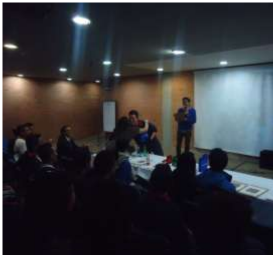
Ceremonia Premier y Premiación de los mejores propuestas de Video Proyectos para la Video-teca 2011.