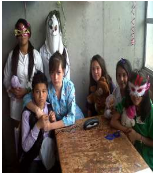
Pre-producción de Video-propuestas.