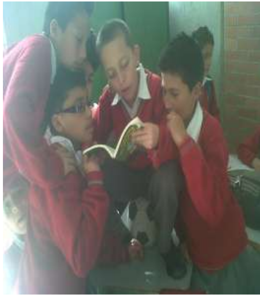
Selección de Obras Literarias-realización de Guiones.