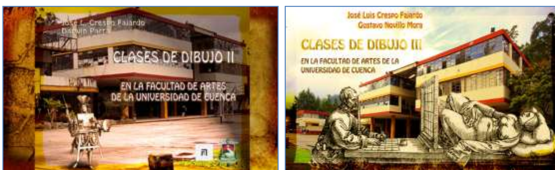
Portadillas de los videos que realizamos sobre nuestras actividades docentes en las Cátedras de Dibujo II y Dibujo III.

Las Jornadas de educación Artística 2.0, de la profesora Ángeles Saura, nos han descubierto las posibilidades del video para dar a conocer de modo eficaz el trabajo que hacemos en clase, en la medida que un video subido a internet puede circular por redes sociales, y divulgarse fácilmente en blogs, revistas, periódicos y todo tipo de plataformas on line. De tal modo, a lo largo de este curso hemos realizados hasta el momento dos videos acerca de las actividades en las clases, y con estos videos hemos participado en diferentes eventos académicos internacionales. Estos videos fueron publicados en el portal de Youtube de la Universidad de Cuenca, recibiendo una importante cantidad de visitas, significando de este modo un medio estimulante para dar a conocer nuestro trabajo docente