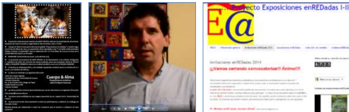
Convocatoria de la exposición Cuerpo & Alma, video de invitación y blog del proyecto Exposiciones enREDadas.

En esta exposición participan obras llegadas de todo el mundo, enviadas por correo, a modo de arte postal. No obstante, una importante cantidad de obras han llegado simplemente en formato virtual, vía correo electrónico. Nuestra labor es imprimir las obras en formato de 15 x 10 cm, como si fuera una postal, y disponerlas en la sala de exposición en un espacio reservado. Respecto a la mayor parte de los trabajos, provienen de parte del alumnado de la Facultad de Artes, especialmente de las carreras de dibujo y diseño, para quienes esta experiencia de exposición, organización y montaje es en muchos casos la primera, por lo que se trata de una actividad sumamente didáctica. El gran interés de esta muestra -desde un punto de vista de meritos expositivos- es que Cuerpo & Alma está categorizada como una exposición internacional.