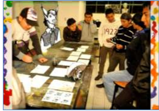
Fotogramas del video Clases de Dibujo II en la Facultad de Artes de Cuenca

Asimismo, las imágenes retocadas que integran estos videos fueron las acompañantes de comunicación que tuvimos la suerte de poder presentar en el 9º Congreso Universidad 2014, celebrado en La Habana, Cuba, donde mostramos el trabajo realizado en las mencionadas asignaturas de Dibujo II y Dibujo III en la Facultad de Artes. Por último, mencionar que estos videos fueron elogiados por el personal directivo del Servicio de Comunicaciones de la Universidad de Cuenca, que los exhibió en las pantallas del centro comercial Mall del Rio como parte de su promoción.