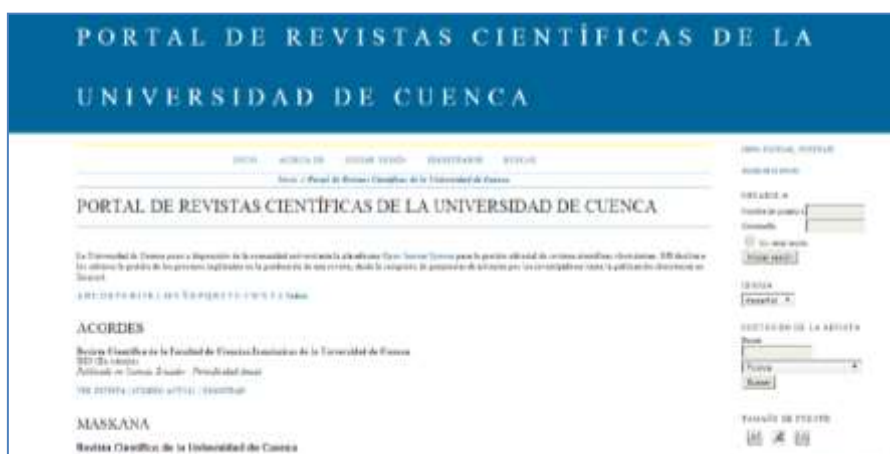
Portal de revistas académicas de la Universidad de Cuenca, en formato OJS

Aquella publicación que tiene como medio de difusión internet tiene garantizada la universalidad, pudiendo el contenido y la información alcanzar cualquier país, mientras la edición en papel habría de invertir gran coste para alcanzar siquiera un ámbito regional. En el año 2000 ciertas estadísticas calculaban en un 50 % la reducción de gastos de edición de una revista que pasa del papel al formato electrónico 3 . Actualmente, con la ayuda de programas gestores de contenidos, el gasto podría ser lo mínimo.