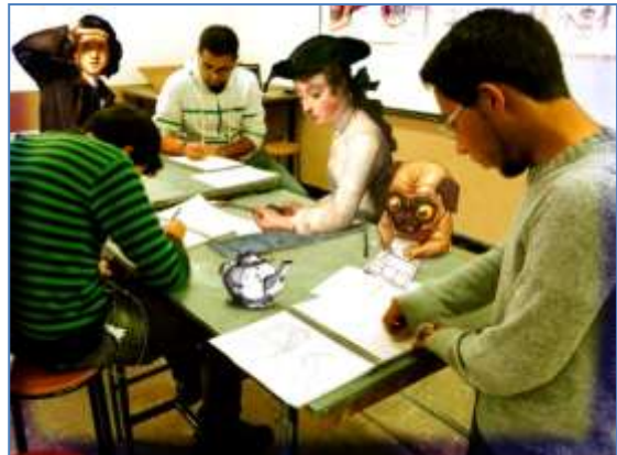
Fotogramas del video Clases de Dibujo III en la Facultad de Artes de Cuenca

Mencionemos a continuación el proyecto expositivo que estamos llevando a cabo en la Facultad de Artes de la Universidad de Cuenca, titulado Cuerpo & Alma . Esta iniciativa consiste en una exposición colectiva coordinada por nosotros y que forma parte del proyecto Internacional "Exposiciones enREDadas", avalado por InSEA (International Society for Education Through Art). A lo largo y ancho del mundo se van a realizar distintas exhibiciones en el marco de este proyecto, que se encuentra centralizado en un blog, a través del que se dan a conocer las distintas convocatorias. Su objetivo es celebrar la III Semana Internacional de la Educación Artística (UNESCO, 2014), dando visibilidad al trabajo realizado por docentes y estudiantes de arte de diferentes contextos y regiones del mundo.