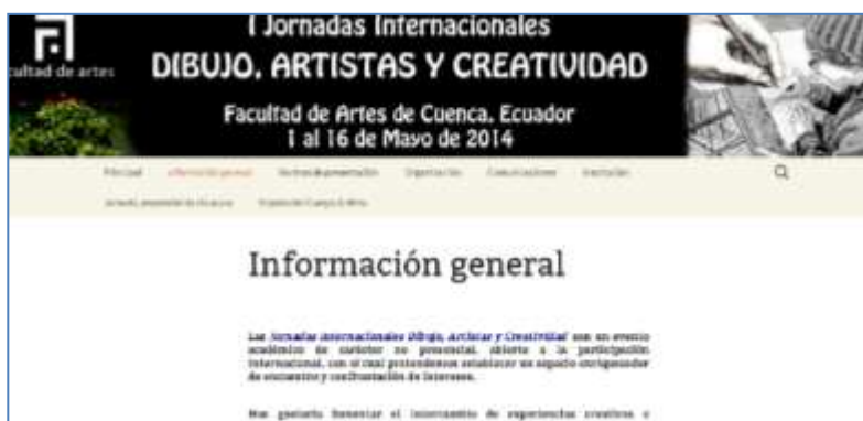
Poster divulgativo y página web de las Jornadas Internacionales Dibujo, artistas y creatividad

Por otro lado, entre las actividades de estas jornadas está la exposición completamente virtual de un artista invitado. En estas jornadas estamos experimentando cómo será la reacción de los internautas y el público a la visualización on line de una exposición., Y en caso de tener éxito, dentro del proyecto de