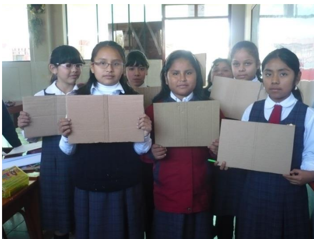
Elección del cartón y corte de las tapas.