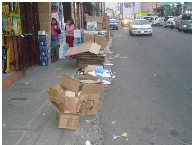
Recojo del cartón de los mercadillos de Tacna.