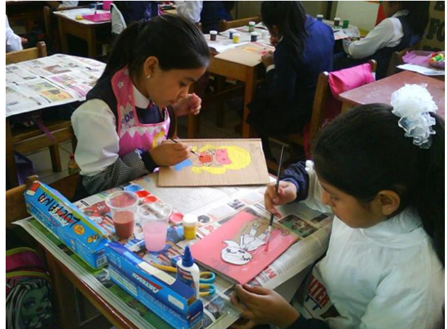
Diseño y pintado de las tapas del librito cartonero.