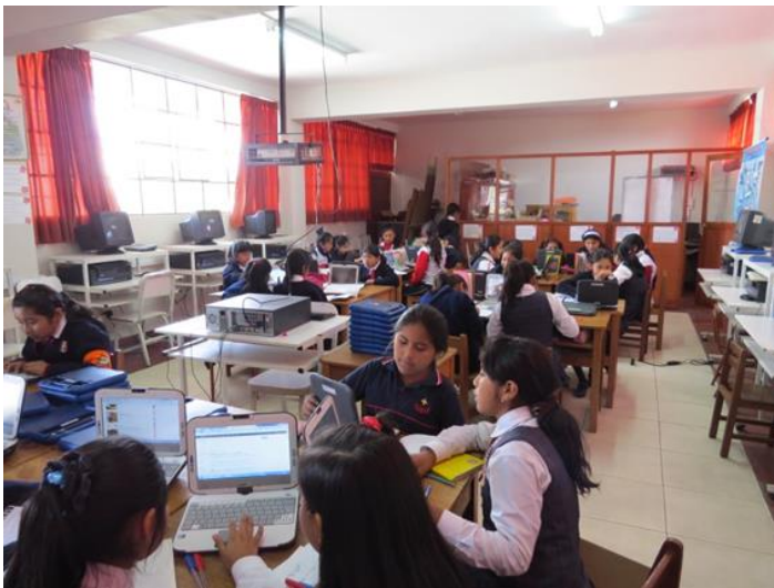
Usando herramientas digitales educativas (Classmate) para investigar, previo a sus creaciones.