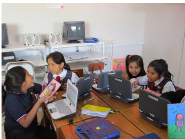
Realizando aprendizaje colaborativo con sus compañeras de aula.