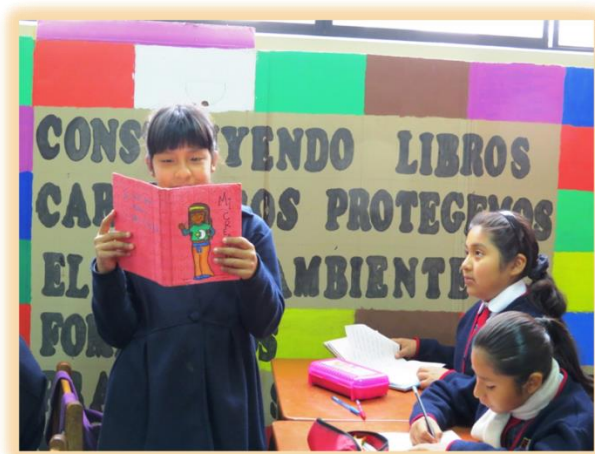
Compartiendo sus textos creados con sus pares.