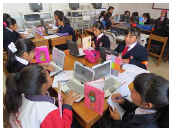
Difundiendo sus creaciones a través del blog y redes sociales del proyecto.