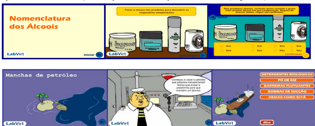
Figura 5. Imagens de simulações encomendadas por alunos de ensino médio e publicadas no website www.labvirt.futuro.usp.br

Após a produção da simulação, é feita uma nova avaliação, pelo químico educador, a fim de constatar se a imagem produzida atende a encomenda e se o conteúdo e a linguagem química trabalhada não sofreu distorções no processo de representação. Feita esta última avaliação, é autorizada a publicação da simulação no website (Figura 5)