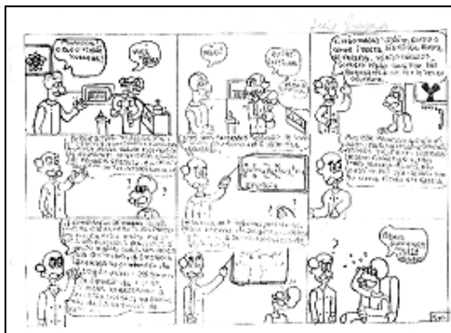
Figura 3. Imagem de “Storyboard” da simulação Fissão Nuclear encomendada por alunos e publicada no portal web do Labvirt Química.

Durante a execução do projeto, deparou-se também com uma forma de se encomendar que não contemplava as etapas do roteiro, e que estava ligada às dificuldades de acesso a computadores para a elaboração de roteiro em forma de arquivo digitado. Aceitou-se, então a encomenda na forma de “gibis” impressos nos quais, ao invés de descreverem as cenas, os alunos desenharam cada etapa e enviaram à equipe de produção através do professor ou via correio (Figura 3).