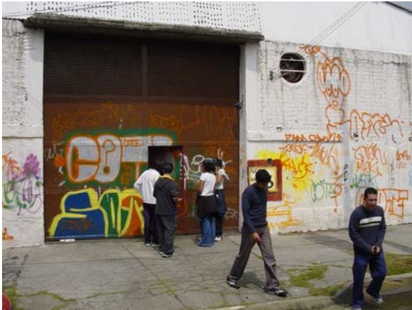
Varios alumnos tratando de entrar el depósito de reciclado de basura, en el cual nunca reconocieron que fuera.

Uno de los dos equipos en los que se dividió la primer visita de acercamiento a los Grandes Retos de La Humanidad en una visita a “su contexto”.