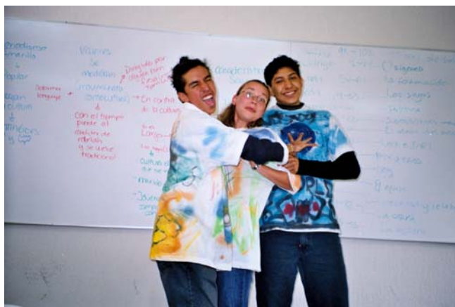
Alumnos realizando una dinámica relacionada con el Reto de la Humanidad “La Persona”