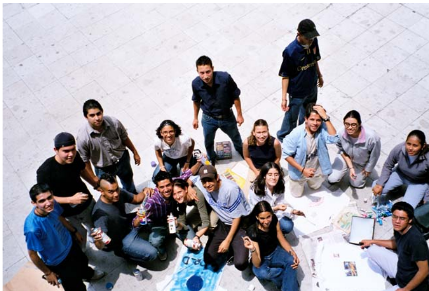
Todos los alumnos realizando una dinámica relacionada con el Reto de la Humanidad “La Persona”