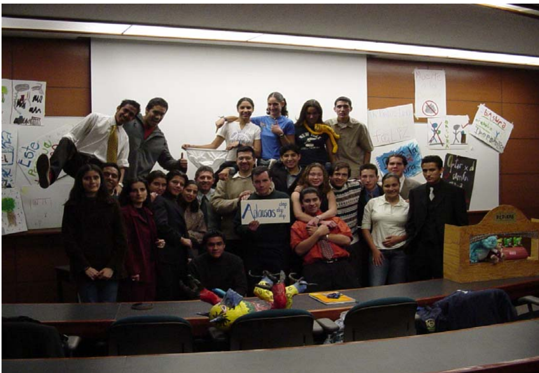
Todos los integrantes del equipo – alumnos y profesores- el día de la evaluación final.

de las mascararas, como dinámica de acercamiento a los Grandes Retos de la Humanidad, en la parte del Hombre, corporal, psicológico y espiritual. Esta dinámica está basada en la lectura Las máscaras del escritor mexicano y premio Nobel Octavio Paz.