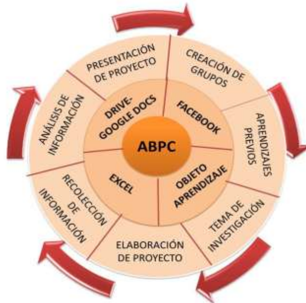
Figura 4: Descripción ambiente de aprendizaje con ABPC y mediación de TIC.

A continuación se describen las etapas del desarrollo del proyecto en el aula, donde se evidencia la metodología de aprendizaje y la utilización de las TIC.