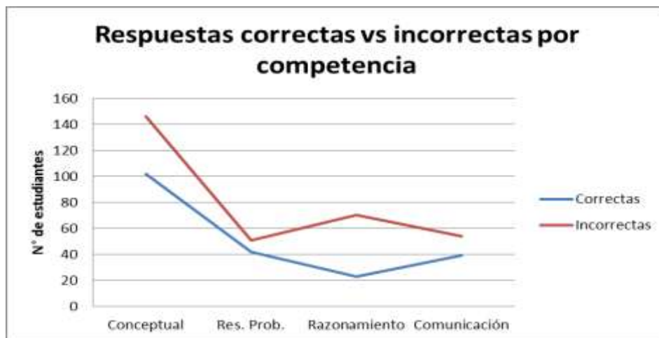
Figura 3: Número de respuestas correctas frente a las incorrectas en la prueba diagnóstica.

En la figura 3 se observa el número de preguntas correctas e incorrectas, obtenidas en la prueba diagnóstica aplicada a los estudiantes de grado 8.