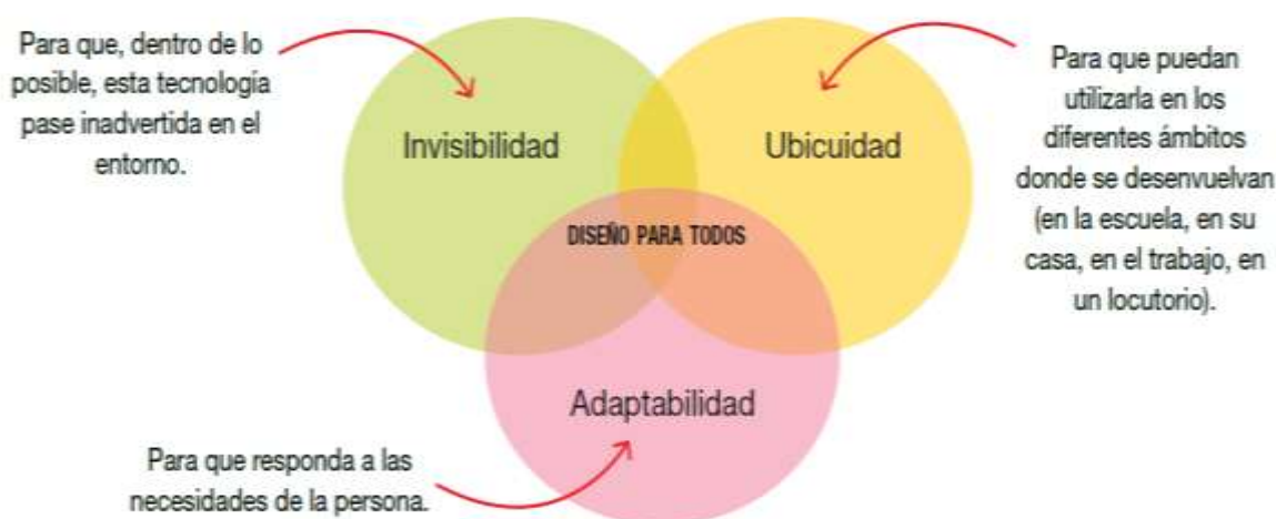
Imagen 9. Diseño Universal.

Fuente: http://escritorioeducacionespecial.educ.ar/datos/recursos/pdf/m-intelectuales-1-40.pdf