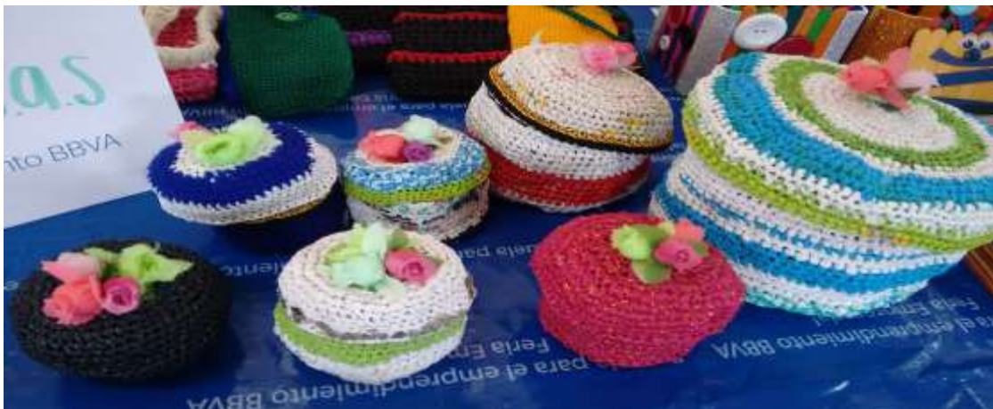
Imagen 6. Producto tejido a partir de bolsas plásticas.

Las políticas educativas de una nación son de mayor calidad cuando son capaces de recibir y atender de la mejor manera posible a sus estudiantes con Necesidades Educativas Especiales. Los términos inclusión, normalización, atención a la diversidad, deben diariamente formar parte del vocabulario docente habitual y deben estar contemplados en la totalidad de los proyectos educativos institucionales que se precien de serlo. Avanzar en una plena y satisfactoria escolarización en todos los órdenes de los aprendices con NEE temporales y/o permanentes por diferentes causas debe ser uno de los grandes objetivos educativos.