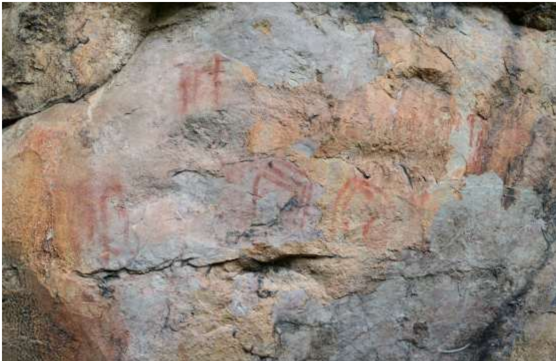
Imagen 1. Pictogramas Municipio de Bojacá, Cultura Muisca.

En una institución educativa, se acude a la tradición oral del municipio o región para recoger la información pertinente a la cultura indígena que habitó en dicha zona geográfica; por medio de la recolección de imágenes de pictogramas que se pueden apreciar en las rocas se aprecian algunos vestigios de las actividades económicas de la antigua región; con la ayuda de la observación directa de las constelaciones, planetas y estrellas se analizan las épocas de siembra y cosecha de los primeros habitantes del municipio; finalmente se aprovecha cada uno de los paisajes típicos de la región para generar un espacio de creatividad en donde los estudiantes con Necesidades Educativas Especiales diseñen y elaboren productos como postales, estampados, tarjetas y otros elementos que promuevan las tradiciones y creencias del municipio, por medio del uso de técnicas de trabajo manual como bordados, moldeado, y de herramientas tecnológicas como Paintshop pro, Publisher, Power point, Picasa entre otras, con el fin de integrarse a la comunidad por medio del montaje de ideas de negocio y el trabajo cooperativo entre familia, estudiante, colegio.