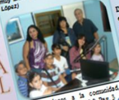
Proyectándonos a la comunidad. Visita a Radio Mundo SS.9. Pág. 5