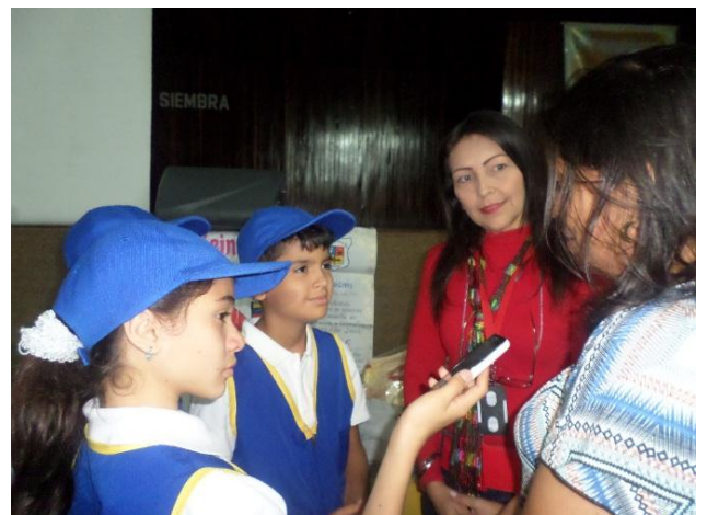
Entrevista en eventos educativos, fuera de la institución.