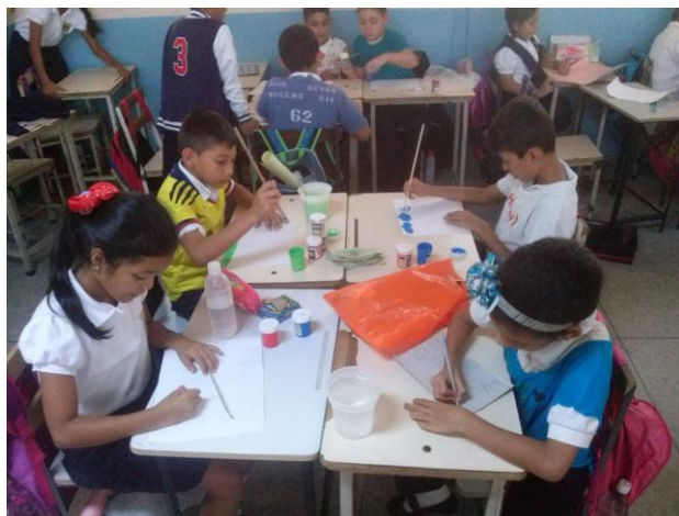
Creación de dibujos para el periódico