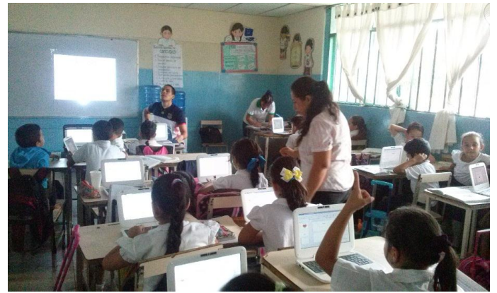
Taller de periódico mural inicio al periodismo Clases para recolectar información y digitalización.