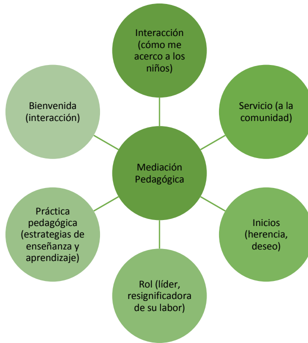
Gráfico 4. Esquema mediación pedagógica.