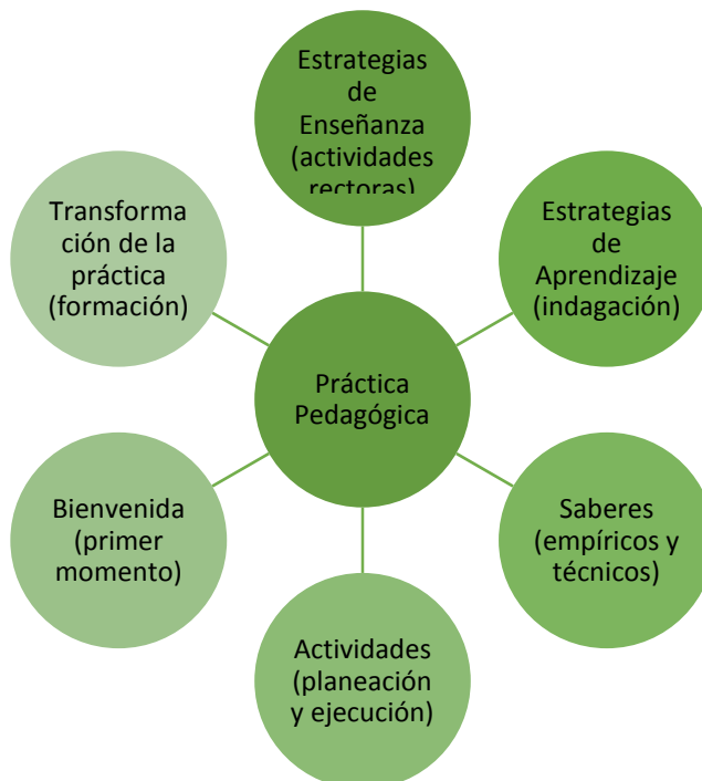
Gráfico 5. Relación subcategoría práctica pedagógica.