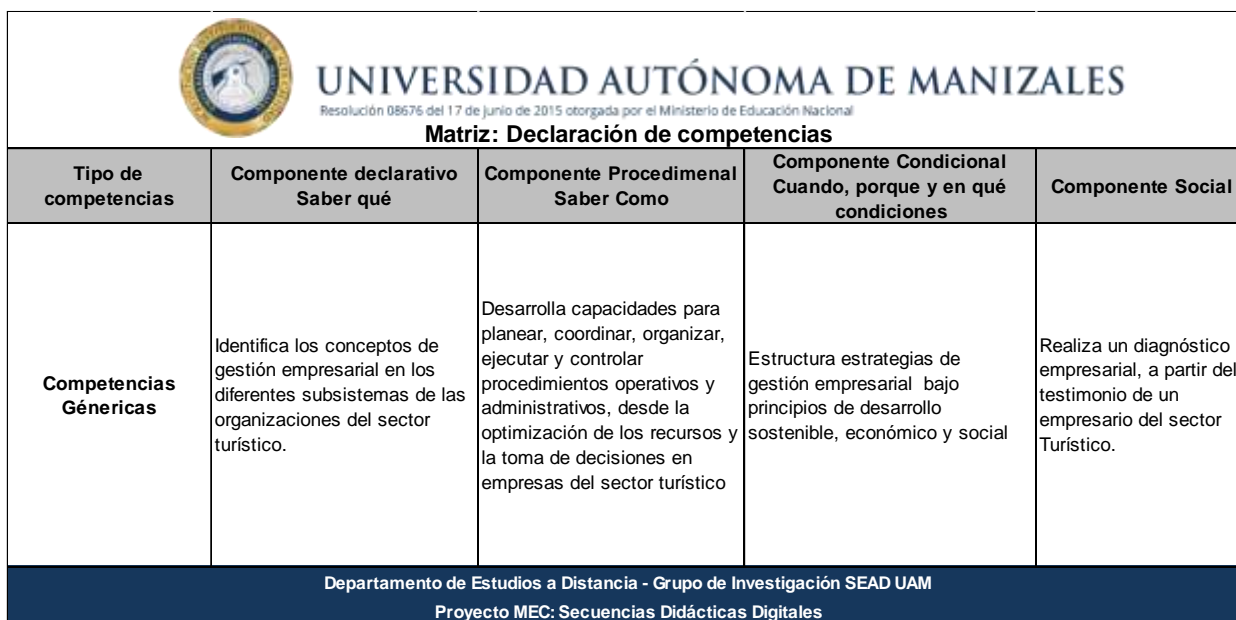
Figura 1: Declaración de competencias del SST en el periodo 2016-02.

componentes: componente declarativo procedimental, condicional y social como se observa en la Figura 1.