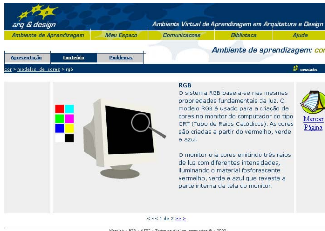
Figura 03 – Interface de uma tela de conteúdos do núcleo de informação

complementar (artigos, livros e sites afins aos temas abordados). O conjunto de conteúdos está estruturado de forma flexível e interativa e pode ser acessados segundo os interesses dos aprendizes, independentemente de tempo e lugar. A base teórica do núcleo de informação está agrupada em cinco eixos, a saber: conceituação, classificação, modelos cromáticos, composição e reprodução de cores. No primeiro eixo conceitua-se cor a partir de suas implicações no âmbito da física, da fisiologia da percepção e da cultura. O tópico modelos de cores trata das características e usos dos sistemas RGB, CMYK, HSB, HSV, CIE-LAB, Munsell System e NCS. No item composição são explorados princípios de combinações cromáticas, estratégias de harmonia e contraste. O tópico reprodução de cores aborda os sistemas de reprodução, suas particularidades e aplicações. Neste tema também são tratadas as aparentes modificações que a cor sofre em relação ao contexto formal, ao ambiente e a iluminação.