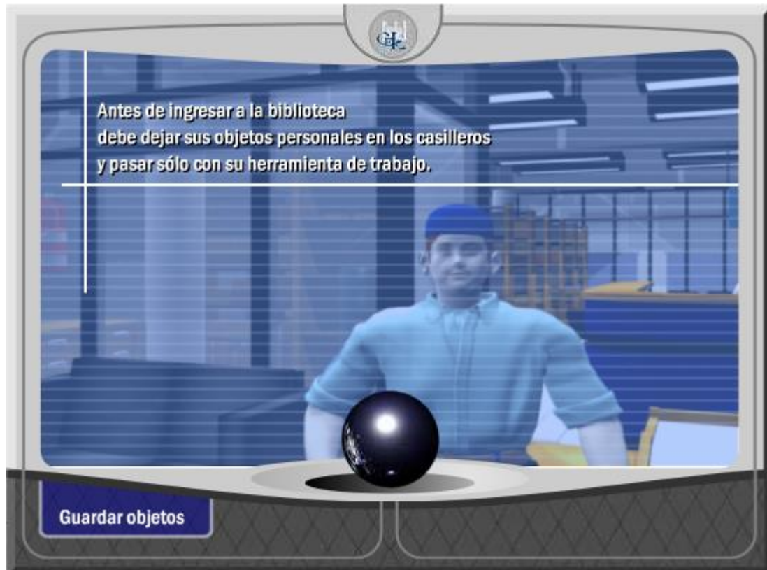
Figura 3b. Recurso interactivo, Sesión inicial.

La figura 3b muestra otro ejemplo de recurso interactivo.