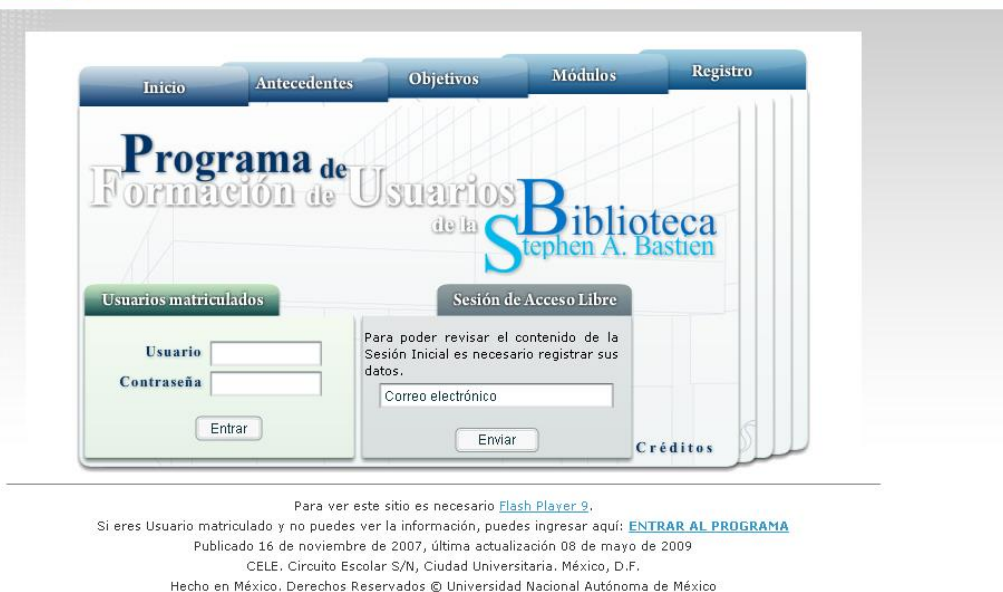
Figura No. 5. Acceso al PFU.

Actualmente en el módulo “Herramientas de Investigación” del CFPL-C, están matriculados 22 estudiantes de las áreas de inglés y de francés las cuales conforman la generación 2009.