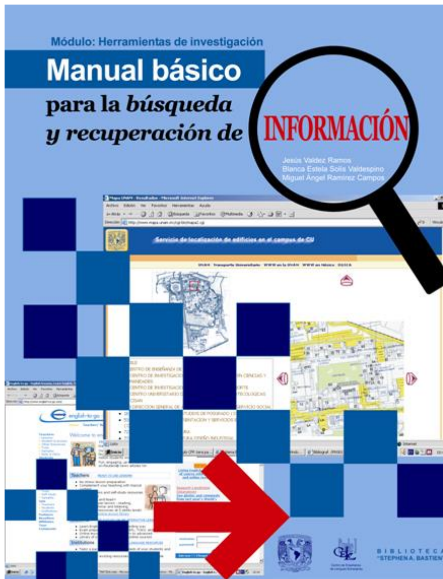
Figura No. 3 Manual básico para la búsqueda y recuperación de la información

B. El Tutorial “Sesión inicial para la búsqueda y recuperación de la información” , se fundamenta en los aspectos teóricos del aprendizaje significativo, además de atender a los aspectos de diseño en plataformas de gestión del aprendizaje (p. ej. moodle). Para la sesión inicial del PFU en línea se estableció como Objetivo General Promover el desarrollo de habilidades que permitan utilizar de manera eficiente los recursos documentales impresos y digitales del área de lingüística, lingüística aplicada y enseñanza de lenguas que posee la biblioteca ‘Stephen A. Bastien’ . La población meta está conformada por los: profesores de tiempo completo y de asignatura; estudiantes del posgrado en lingüística y del CFPL-C; participantes de los diferentes diplomados que se imparten en el CELE y estudiantes de los programas de licenciatura y posgrado en lingüística y enseñanza de lenguas que se imparten en diferentes universidades públicas en México. De forma general se siguieron una serie de recomendaciones para el diseño de un tutorial, las cuales indican los siguientes elementos: