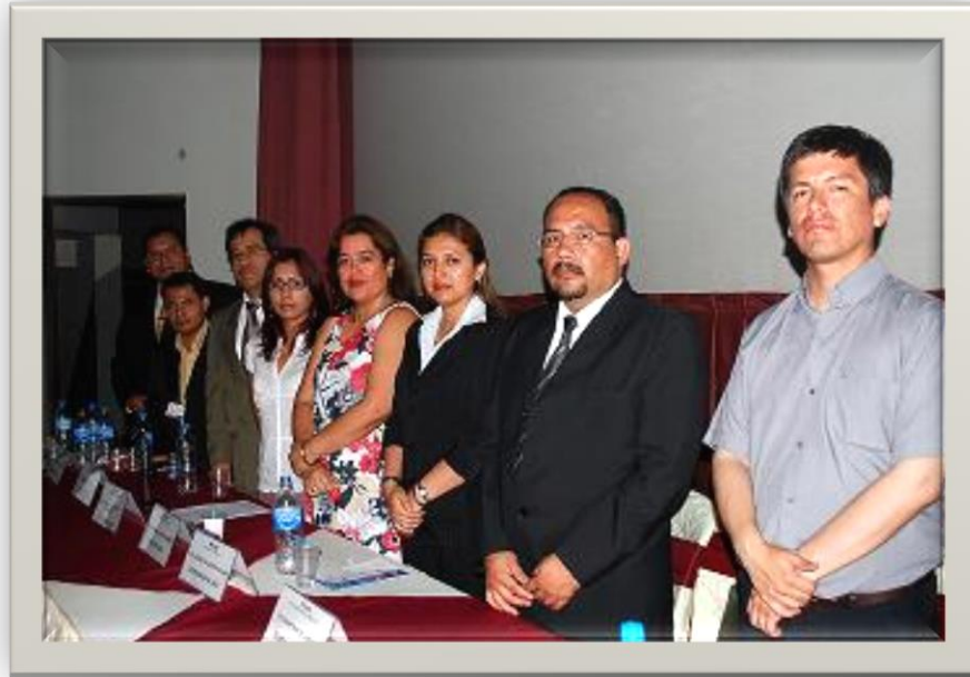
Equipo de EAD en el Taller Presencial Obligatorio de Inducción para alumnos ingresantes Universidad Alas Peruanas Lima - Perú