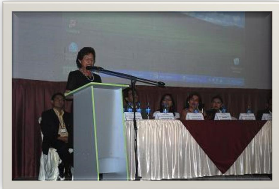
Testimonio de Abogada – Egresada Modalidad a Distancia Universidad Alas Peruanas Lima - Perú