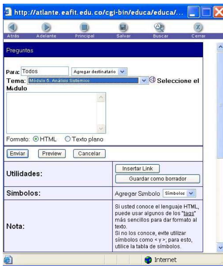
Fig. 2. “Preguntas en IETool”

Las actividades dentro de IETool consisten en hacer preguntas a los estudiantes que motiven su reflexión, debate e investigación. En el marco de las actividades se desarrolló un código de colores para facilitar la identificación de las participaciones, se dividió en: opiniones propias, opiniones del colectivo, referencias y preguntas. Los estudiantes deben responder dichas preguntas procurando sustentar cada intervención con alguna referencia bibliográfica (ya sea algunas de las dadas por el profesor o alguna que sugiera el estudiante) y presentando casos prácticos de aplicación. Las preguntas pueden ser dirigidas a una persona o se puede generar una nueva pregunta para el colectivo. Al momento de hacer preguntas los estudiantes podían adjuntar un enlace a una página web o documento. Ver Fig. 2 “Preguntas en IETool”.