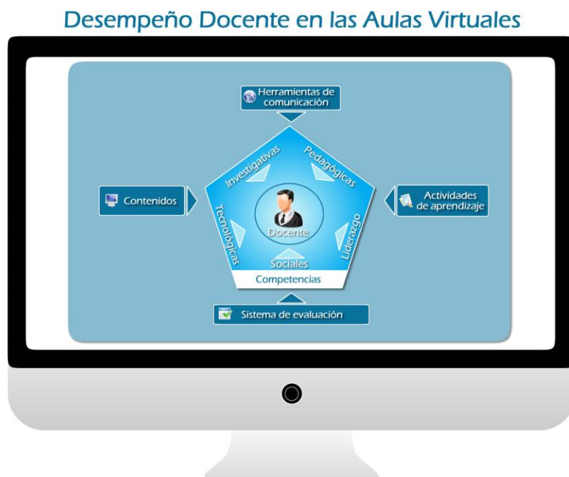
Figura 1. Desempeño del docente en las aulas virtuales. Basabe (2011).

El sistema de evaluación que se propone considera a las competencias del docente que se desempeña en las aulas virtuales, según lo establecido por Campos, Brenes y Solano (2010). (Ver figura 1).