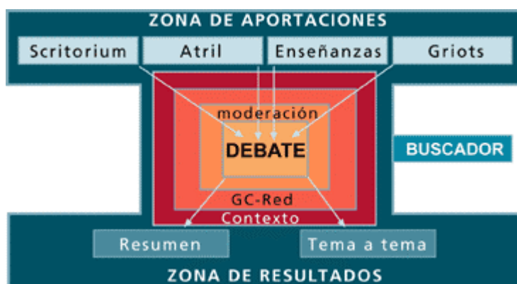
Gráfico No.2: baraz@

baraz@ contextualiza el plan de estudio del Master, le dota de objetivos específicos y promueve, a través del trabajo colaborativo, la generación de una base de conocimiento organizada, estructurada, consultable y diseminable. Una base de conocimiento de la que, adecuadamente tratada, se extraen diversos productos de conocimiento, como pueden ser materiales pedagógicos, multimedia, contenidos para seminarios y conferencias, análisis de tendencias y orientativos, documentos, etc.