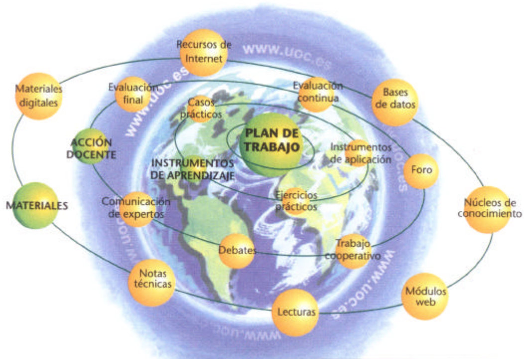
Figura 2. Diseño de Materiales Didácticos Multimedia para entornos virtuales de Aprendizaje. Edulab (UOC) (2001) p. 3

progreso técnico y dominio de nuevas tecnologías, no hay avance tecnológico sin desarrollo científico y, a su vez, este hunde sus raíces en un sistema educativo de alta calidad, la cual se refiere principalmente a la universidad. Las sociedades que no cuentan con un sistema educativo, universitario, científico y tecnológico de gran calidad, y que no forman parte activa de algunos de los bloques económicos mundiales, enfrentan la posibilidad de que la Globalización les produzca efectos sumamente negativos, que aumenten la brecha que separa las sociedades desarrolladas de otras de muy bajo desarrollo. Frente a tales condiciones, un instrumento fundamental para modificarlas, sería una universidad configurada como una institución globalizadora y virtualizada .