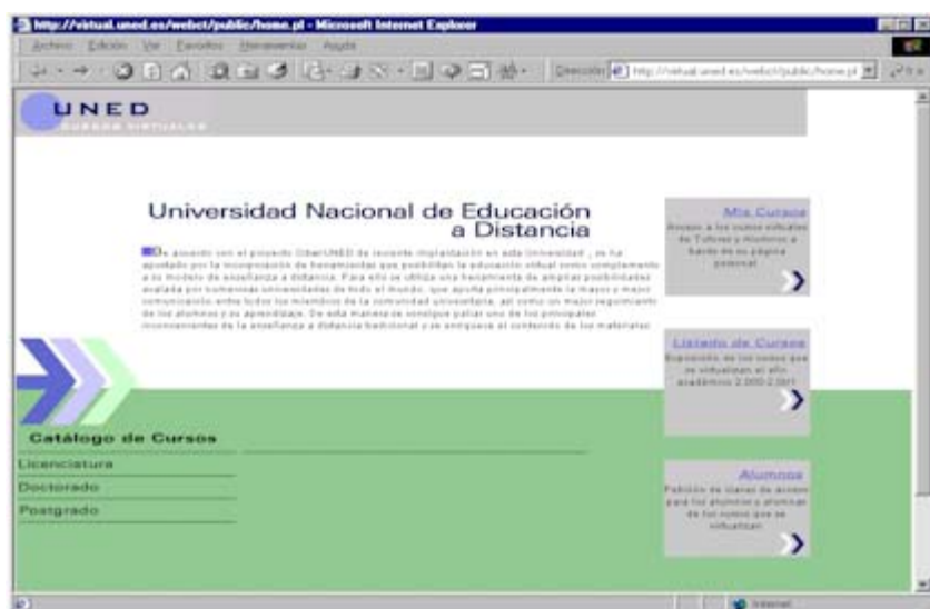
Figura 1.- Página principal de acceso a los cursos virtuales de la UNED

La UNED se estructura, asimismo, en una extensa red de Centros Asociados repartidos por toda nuestra geografía que, junto con los que la UNED posee en otros países de Europa y América, conforman la mayor red educativa conocida hasta el momento. Los Centros Asociados son las sedes a las que los alumnos pueden acudir para establecer contacto personal con su tutor, y, con frecuencia, se erigen en importantes puntos de referencia culturales de las zonas en las que su ubican.